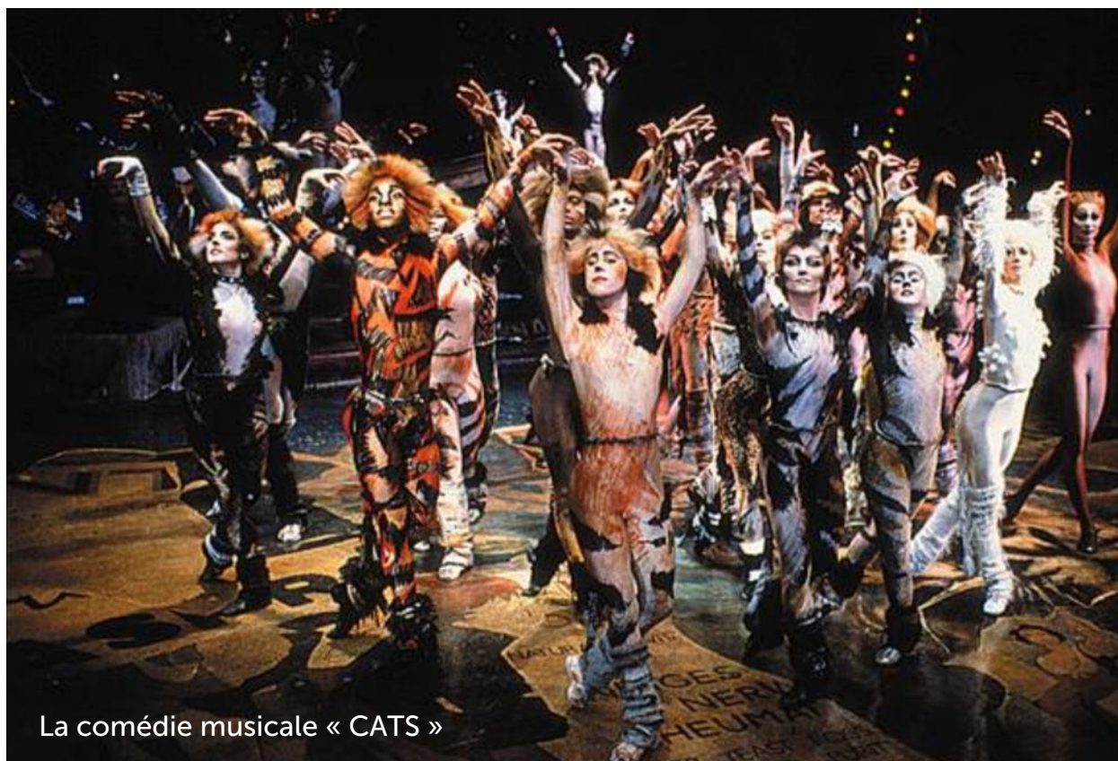
La comédie musicale « CATS »

Une comédie musicale est une pièce de théâtre en musique dont les chansons font avancer l'action et/ou expliquent ce qu'un pense ou ressent un personnage. Comédie musicale est un terme populaire. En principe, devrions employer le terme « théâtre musical »